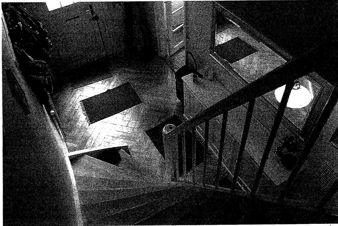
SKOPARKERING. I entreen er der bygget et skoskab, som er passet ind i husets stil ved at genbruge låger fra gamle køkkenskabe.