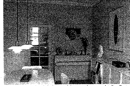
STIL. Der er en herskabelig antydning over husenes detaljer. De to stuer, som ligger en suite, er dekorerede med stukant og i spisestuen er der høje træpaneler.

Huse for sin egen forfængeligheds Skyld – og helst heller ikke for sin Bygherres – men for at løse et samfundsmæssigt Spørgsmål: hvordan skal saa mange som muligt få de bedst mulige Boliger?.