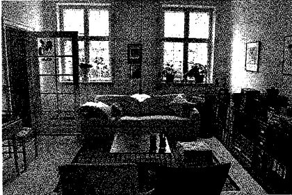
ENKELT. Husets ramme og stil er fulgt op med en nutidig indretning, i stuen med sofabord og lænestole af Poul Kjærholm.